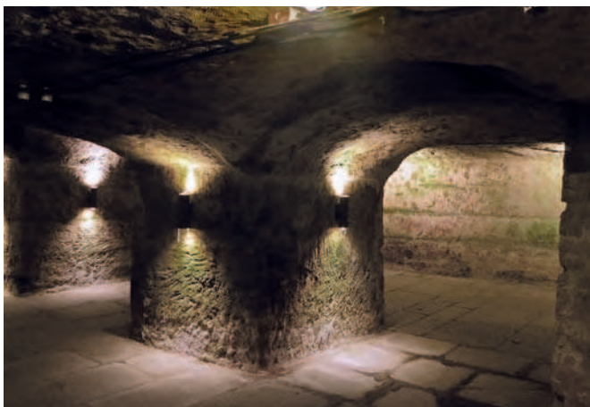
Felsenkeller unter dem Nürnberger Burgberg, erstmals erwähnt 1380