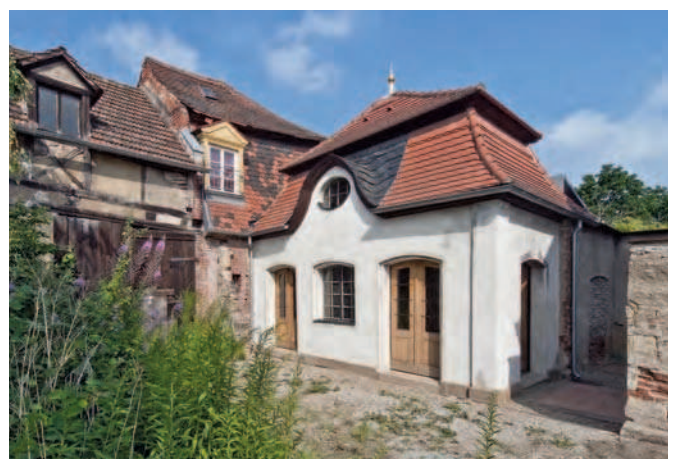
Bamberg. Mang'sche Wachsbleiche, sog. „Himmelfahrtspavillon“ Tocklergasse 37