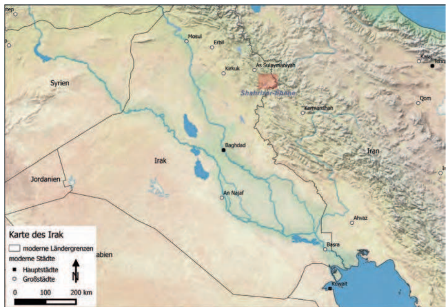
Das rotmarkierte Untersuchungsgebiet in Kurdistan im Nordosten des Iraks (Karte: Simone Mühl)

Die Shahrizor-Ebene ist ein etwa 1300 km 2 großes Tal am Rande des