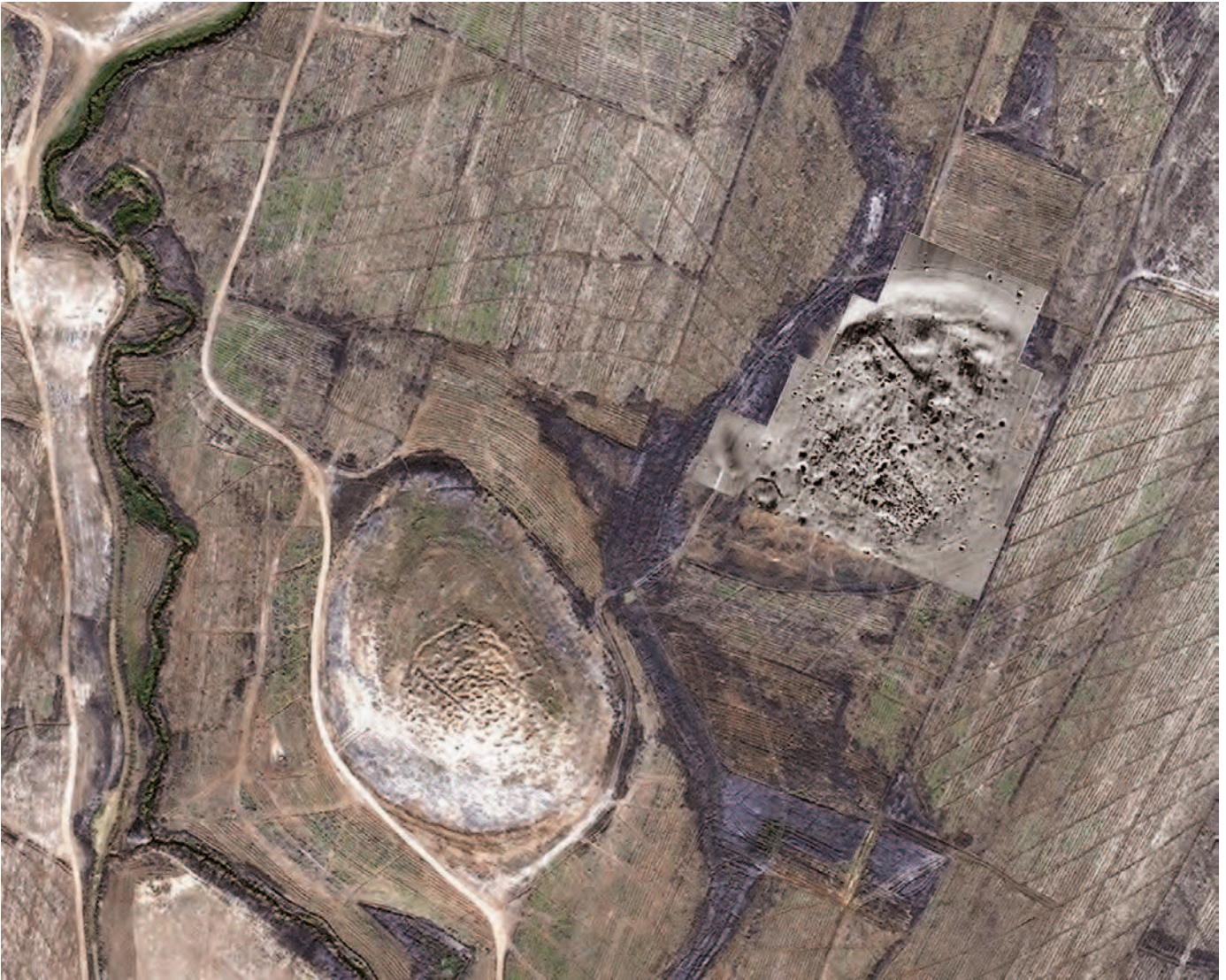
Kazhaw. Siedlungshügel und Ergebnisse der Magnetometermessungen im Bereich der Unterstadt

allen Funde der neuassyrischen Epoche. Allen drei Orten ist darüber hinaus eine frühneuzeitliche Besiedlungsphase gemeinsam, wie sie an vielen Stellen in der Ebene nachgewiesen werden konnte. Die untersuchten Hügel gehören mit Höhen bis 13 m und bis zu 12 ha Fläche eher zu den mittelgroßen Siedlungen in der Region. Die systematische archäologische Prospektion der Oberfläche hat überdies deutlich gemacht, dass die gesamte Fläche niemals in allen Perioden besiedelt war.