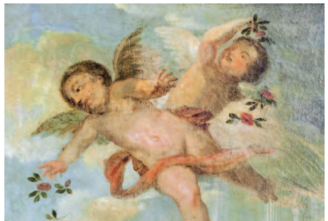
„Tempelgang Mariae“ von M. Kager, Detail