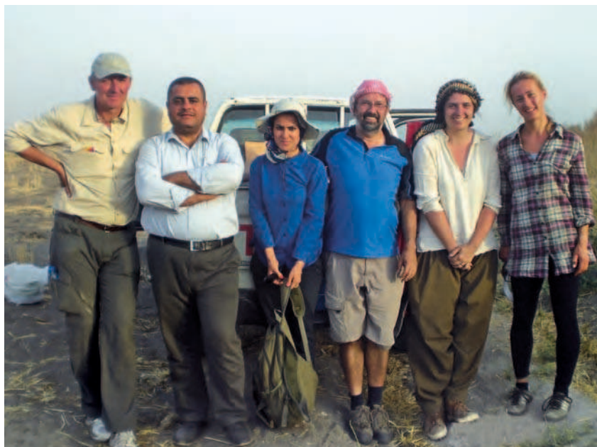
Das Prospektionsteam in Kurdistan

vermutlich über die Shahrizor-Ebene bis hin zur etwa 100 km nordwestlich gelegenen Ranya-Ebene erstreckte, war zu dieser Zeit das Ziel zahlreicher Feldzüge mesopotamischer Herrscher. Um die Mitte des 2. Jahrtausends brechen die historischen Informationen über die Region ab und erst im 12. Jahrhundert v. Chr. ist Simurram, diesmal unter dem Namen Zabban, wieder durch einen Text aus Assyrien belegt. In neuassyrischer Zeit, also im 1. Jahrtausend v. Chr., wird die Shahrizor-Ebene schließlich zusammen mit benachbarten Territorien als Provinz Mazamua/Lullumu in das Assyrische Reich eingegliedert. Das historische Wissen basiert nur auf wenigen Keilschriftquellen, die meist aus Nachbargebieten in Mesopotamien stammen. Ärmlich steht es auch um die materiellen Hinterlassenschaften.