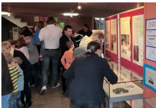
Ausstellung und Aktionstag in der Volksschule Aufhausen-Pfakofen